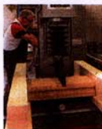
Casadobe® LeichtLehmhourdis im Prüfstand. Beim Biegeversuch beträgt die Bruchlast > 10kN

Casadobe® LeichtLehmhourdis können mit handelsüblichen Werkzeugen und Maschinen gesägt oder gefräst werden.